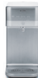
СИСТЕМА ОЧИСТКИ ВОДЫ K890