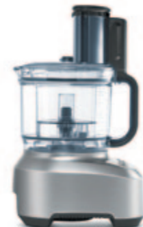
КУХОННЫЙ КОМБАЙН B801