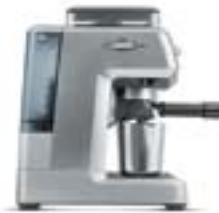
КОФЕЙНАЯ СТАНЦИЯ С801